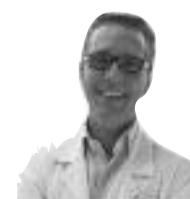
H.J.M. Braat Cardioloog Hospital Clínica Benidorm

te geschieden, het weer openen van het bloedvat. Het zogenaamde dotteren.